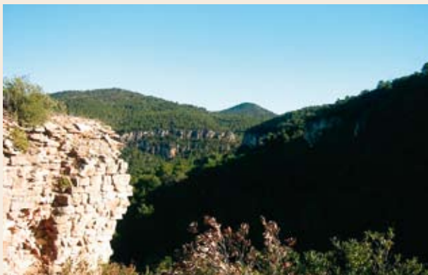
El cono de Montagut desde la ermita de Sant Salvador